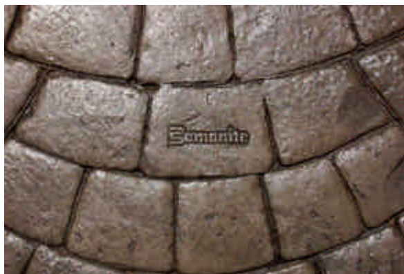
Detalle del molde "espina de pescado".