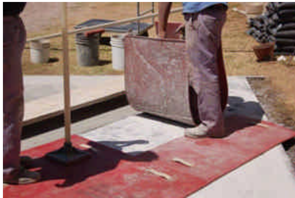
Proceso de estampado con molde

Consiste en una losa monolítica de hormigón fraguada in-situ con aplicación de endurecedores color y desmoldantes color (o desmoldante líquido incololoro) ambos disponibles en 25 colores, estampada con moldes especiales logrando variados diseños, según los distintos moldes : Laja Sillería, Granitullo espina de pescado, Granito, Laja 60x60, Coquina, etc.