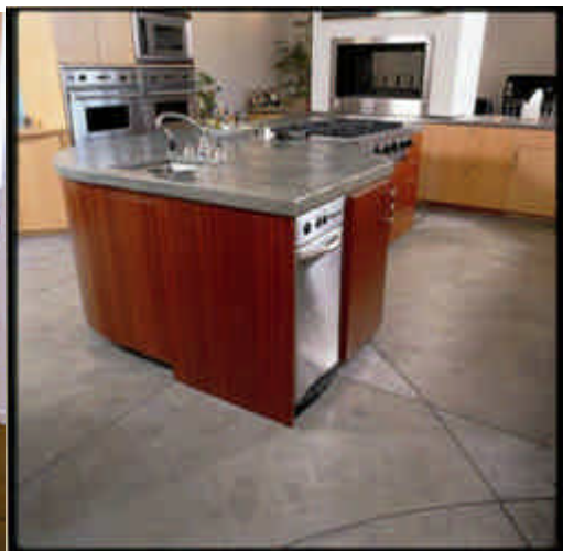
Piso Alisado Níkel Gray. Mesón MicroTop